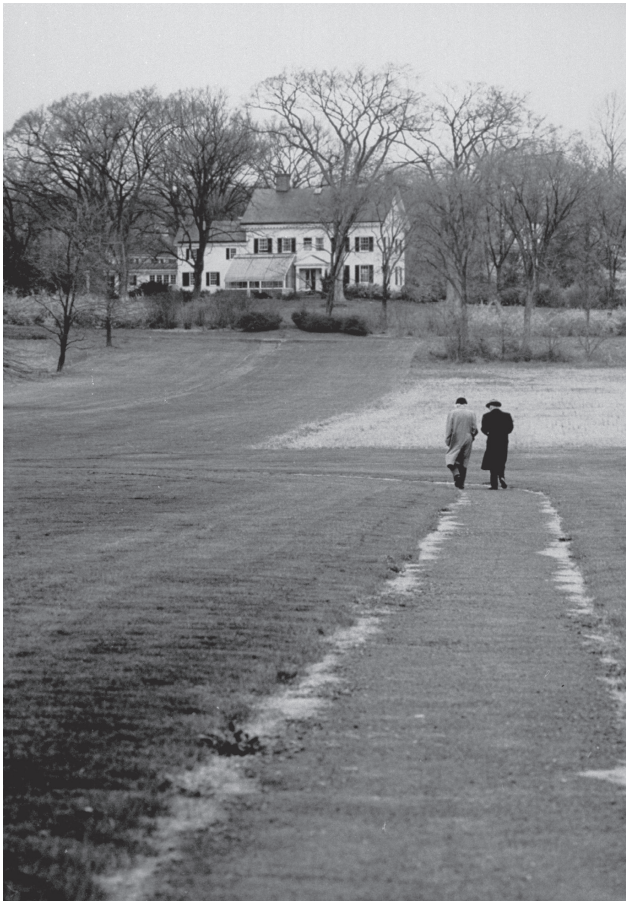
På promenad med Einstein i Princeton

ut »som en fin gammal farfar, något som det inte finns anledning att invända mot«, som Gödel en gång skrev till sin mor till försvar för sin vän när hon hade undrat över Einsteins ovårdade och »oestetiska« framtoning på ett foto som Gödel hade skickat. 4 Och Gödel högtidlig, allvarlig, mager som en skrika, oklanderligt klädd i vit linnekostym och pryddig filthatt även när sommaren var som varmast. Men varenda dag gick de och konverserade livligt med varandra på tyska om politik, fysik, filosofi och om livet.