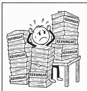
Kan va om man inte har kunskap om ekonomi

Det handlar inte om att pengar är det viktigaste i livet (det är det inte). Men om du aldrig har pengar kan det bli svårare att njuta av sånt som faktiskt är viktigt: kompisar, frihet, kontroll och så vidare.