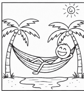
Kan va om man har kunskap om ekonomi

Illustration: Kunskap om ekonomi kan vara en nyckel till dina drömmar.